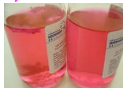
Izda: Mohos en superficie y fondo, Dcha: Levaduras enturbiando