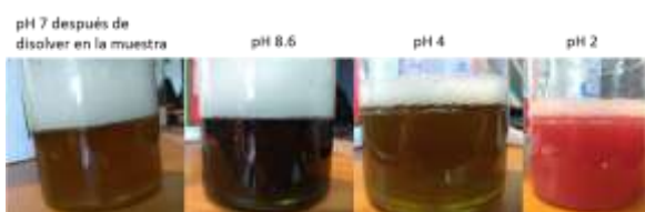
Importancia de ajustar el pH al añadir la muestra de agua al kit

Control de calidad positivo: Vibrio cholerae MKTA 14035. Recomendamos asimismo la participación en servicios intercomparativos como SEILAGUA, para validar los procedimientos y los operarios.